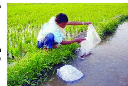
Fig: Rukom pyllait symbai dohkha