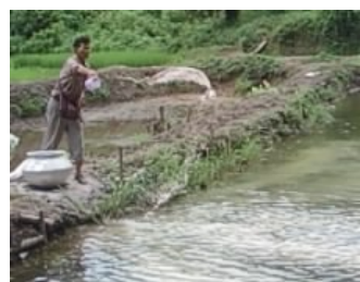
Fig: Rukom ai shun ia ka pung

Wieh shwa ia ka byrni shun hapoh pung katto katne kynta bad nangta sa rah ia ka byrni ha baroh kawei ka pung khnang ba ka shun kan khleh lang bad baroh kawei ka pung. Ha ka pung kaba ryngkhiang, lah ban shu