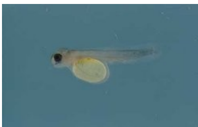
Fig: Ki pylleng dohkha

Hatchling: Ia ki dohkha ba dang shu kha la khot ki 'hatchling'. Ha kane ka por, ki dohkha kim pat don shyntur bad ki ioh ia ka jingbam na ka kynja pla ba don ha ka bynta ba sharum jong ka met.