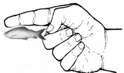
Fig: Ka jingpyni ia ka jingrong ka dohkha fingerling

Fingerlings: haba ki dohkha ki la don kumba 10-15cm ka jingrong lane kat ka jingrong jong ka shympriahkti, la khot ki 'fingerling'. Kane ka long ka jingheh kaba biang na ka bynta ban pyllait ia ki dohkha sha