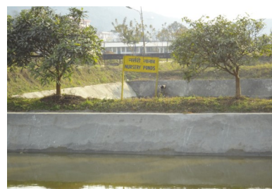
Fig: Ka pung ba shna da ka cement